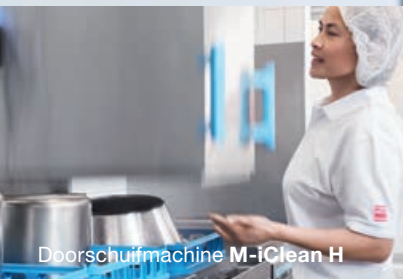
Doorschuifmachine M-IClean H